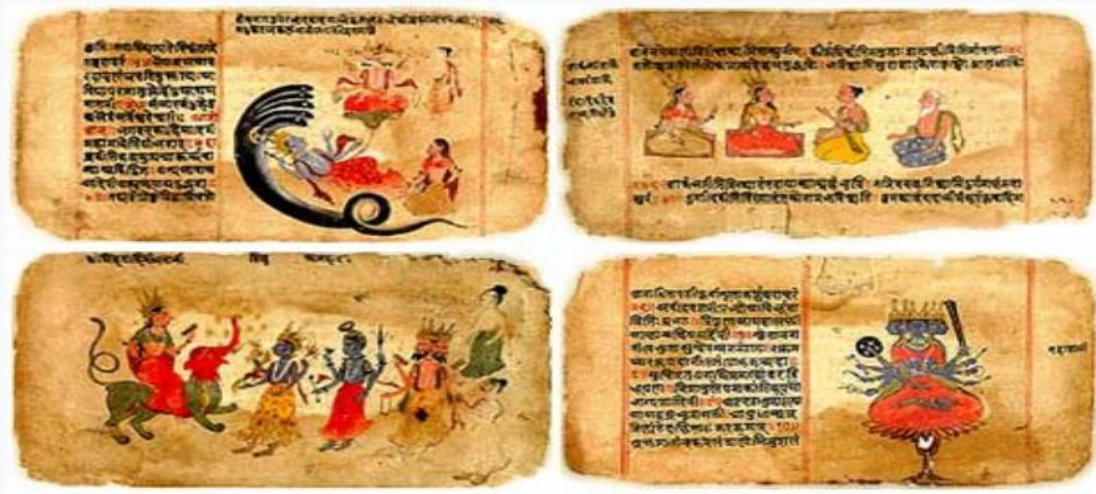
संस्कृत थिएटर संस्कृति

इस वृत्तांत से यह प्रतीत होता है कि नाटक सबसे पहले पौराणिक कथाओं को दर्शाने वाले तमाशे के रूप में शुरू हुआ, पौराणिक या पौराणिक कथाएँ जैसे कि अमृत के लिए दूध-सागर का मंथन और राक्षसों द्वारा या शिव द्वारा एक राक्षस के तीन गढ़ों को जलाना। पतंजलि का 'द किलिंग ऑफ कंस' और 'द बाइंडिंग ऑफ बाली' की नकल के प्रदर्शनों का संदर्भ नाटक की इस मूल अवधारणा के अनुरूप है। और यह भारत में स्थानीय भाषा के नाटक के बारे में भी सच है। समय के साथ विकास की प्रक्रिया में नाटक नश्वर नायकों और सामाजिक विषयों में बदल गया होगा। हालाँकि, पौराणिक और पौराणिक विषयों में लेखकों की रुचि आज भी जारी है। धीरे-धीरे, वीर विषयों पर पहले की एकाग्रता प्रेम के विषय द्वारा पूरक थी। [2] ये जुड़वाँ भावनाएँ संस्कृत नाटक की रचना को नियंत्रित करती हैं। धार्मिक पृष्ठभूमि वाले उत्सव के अवसर का चुनाव काफी स्वाभाविक है। ऐसा अवसर उन लोगों को आकर्षित करेगा जो अपने दिल में भक्ति के साथ गीत, नृत्य और शानदार कार्यक्रमों के प्रति भी संवेदनशील होंगे।