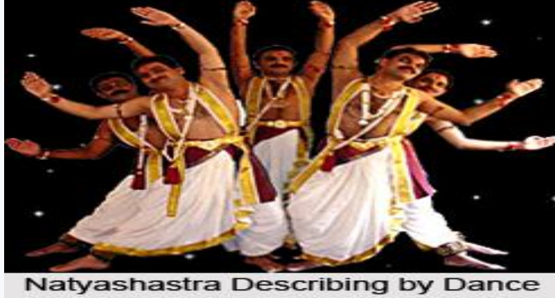
Natyashastra Describing by Dance

साहित्यिक नाटक, जैसा कि हमें भास, कालिदास के नाटकों और अश्वघोष के नाटक के अंशों के माध्यम से जाना जाता है, एक पूर्ण विकसित रूप को दर्शाता है, जिसे औपचारिक प्रकारों में प्रतिरूपित किया जाता है और एक पॉलिश साहित्यिक साँचे में निष्पादित किया जाता है। यह मान लेना स्वाभाविक है कि यह क्रमिक विकास के पूर्ववर्ती चरणों की परिणति है। लेकिन हमारे पास इन चरणों को चित्रित करने के लिए कोई डेटा नहीं है, सिवाय एक तरफ, भरत द्वारा दिए गए पहले प्रदर्शन और नाट्यशास्त्र में दर्ज किए गए, और दूसरी तरफ, पूरी तरह से विकसित पूर्व-शास्त्रीय और शास्त्रीय संस्कृत नाटकों के अलावा। इन दो बिंदुओं के बीच के अंतराल को प्रशंसनीय और उचित अनुमान से भरना होगा।[5]