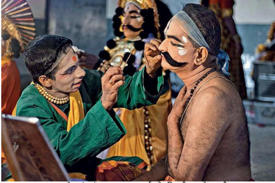
एक लोक रंगमंच कलाकार प्रदर्शन के लिए तैयार हो रहा है

अधिकांश भारतीय शहरों (कोलकाता, दिल्ली, मुंबई, चेन्नई और बेंगलुरु जैसे महानगरों को छोड़कर) में शहरी रंगमंच की अनुपस्थिति में, लोक रंगमंच ने सदियों से ग्रामीण दर्शकों का मनोरंजन किया है।