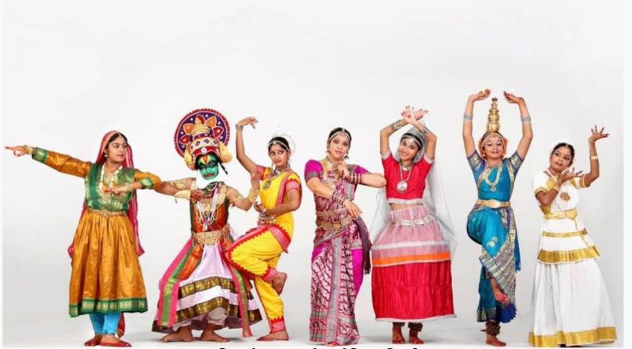
संस्कृत दिवस के उपलक्ष्य में आयोजित कुचिपुड़ी नृत्य

राग परिचयललितविस्तारा, बुद्ध की आरंभिक आत्मकथाओं में से एक में नाटक का संदर्भ मिलता है। अपने त्याग के बाद, बुद्ध ने अपने शिष्यों को नाट्य कला से दूर रहने की सलाह दी। उनका मानना था कि ये कलाएँ कामुक हैं जो उनके मन में भ्रम पैदा कर सकती हैं। लेकिन कालांतर में बौद्ध धर्म का दृष्टिकोण बदल गया। मध्य एशिया में तीन संस्कृत नाटकों के अंशों से पता चलता है कि संस्कृत में सबसे पहले के नाटक बौद्ध विषयों पर थे। उनमें से एक, सारेपुत्र प्रकर्ण को अश्वघोष के रूप में वर्णित किया गया है और यह सारिपुत्र के बौद्ध धर्म में रूपांतरण का वर्णन करता है। दिलचस्प बात यह है कि इस नाटक में बुद्ध स्वयं एक पात्र के रूप में दिखाई देते हैं। एक अन्य नाटक में बुद्ध के साथ 'प्रसिद्धि' और 'बुद्धि' जैसे अलंकारिक चरित्र दिखाई देते हैं, जिसका नाम अज्ञात है।[11]