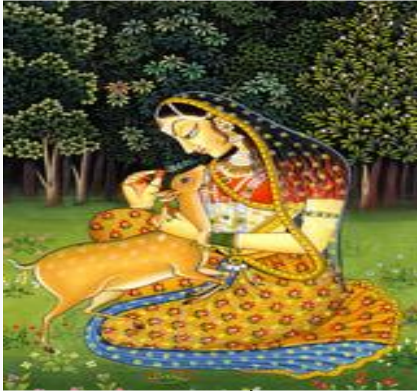
हिंदू (संस्कृत) नाटक का इतिहास और उत्पत्ति

इस वृत्तांत से यह प्रतीत होता है कि नाटक सबसे पहले पौराणिक कथाओं को दर्शाने वाले तमाशे के रूप में शुरू हुआ, पौराणिक या पौराणिक कथाएँ जैसे कि अमृत के लिए दूध-सागर का मंथन और राक्षसों द्वारा या शिव द्वारा एक राक्षस के तीन गढ़ों को जलाना। पतंजलि का 'द किलिंग ऑफ कंस' और 'द बाइंडिंग ऑफ बाली' की नकल के प्रदर्शनों का संदर्भ नाटक की इस मूल अवधारणा के अनुरूप है। और यह भारत में स्थानीय भाषा के नाटक के बारे में भी सच है। समय के साथ विकास की प्रक्रिया में नाटक नश्वर नायकों और सामाजिक विषयों में बदल गया होगा। हालाँकि, पौराणिक और पौराणिक विषयों में लेखकों की रुचि आज भी जारी है। धीरे-धीरे, वीर विषयों पर पहले की एकाग्रता प्रेम के विषय द्वारा पूरक थी। [2] ये जुड़वाँ भावनाएँ संस्कृत नाटक की रचना को नियंत्रित करती हैं। धार्मिक पृष्ठभूमि वाले उत्सव के अवसर का चुनाव काफी स्वाभाविक है। ऐसा अवसर उन लोगों को आकर्षित करेगा जो अपने दिल में भक्ति के साथ गीत, नृत्य और शानदार कार्यक्रमों के प्रति भी संवेदनशील होंगे।