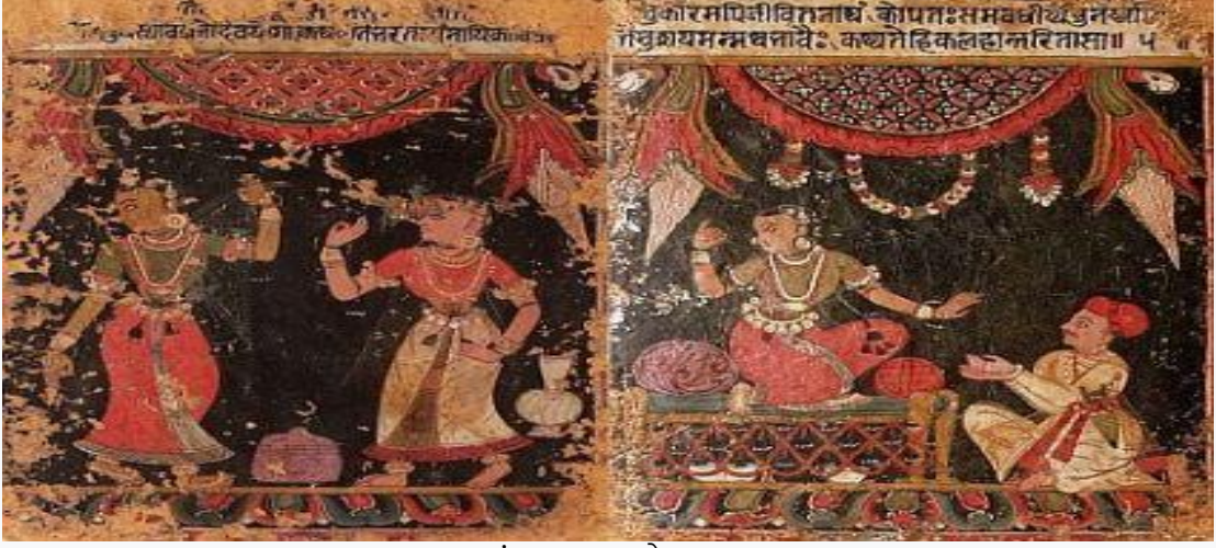
संस्कृत नाटक के रूप

साहित्यिक नाटक, जैसा कि हमें भास, कालिदास के नाटकों और अश्वघोष के नाटक के अंशों के माध्यम से जाना जाता है, एक पूर्ण विकसित रूप को दर्शाता है, जिसे औपचारिक प्रकारों में प्रतिरूपित किया जाता है और एक पॉलिश साहित्यिक साँचे में निष्पादित किया जाता है। यह मान लेना स्वाभाविक है कि यह क्रमिक विकास के पूर्ववर्ती चरणों की परिणति है। लेकिन हमारे पास इन चरणों को चित्रित करने के लिए कोई डेटा नहीं है, सिवाय एक तरफ, भरत द्वारा दिए गए पहले प्रदर्शन और नाट्यशास्त्र में दर्ज किए गए, और दूसरी तरफ, पूरी तरह से विकसित पूर्व-शास्त्रीय और शास्त्रीय संस्कृत नाटकों के अलावा। इन दो बिंदुओं के बीच के अंतराल को प्रशंसनीय और उचित अनुमान से भरना होगा।[5]